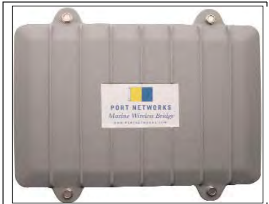
Antennförstärkare WiFi Networks MWB-250 suveränt bra!