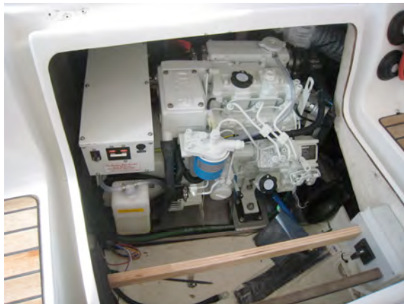
Diesलगenerator Northern Light Sb stuv