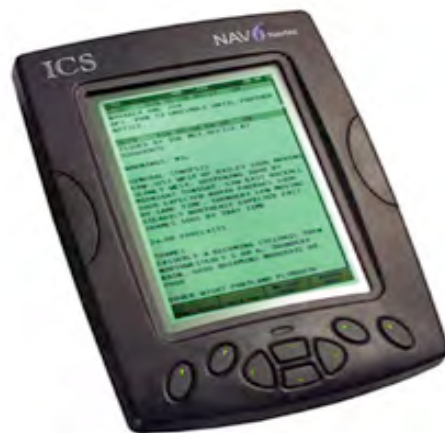
Navtex Nav6 Plus