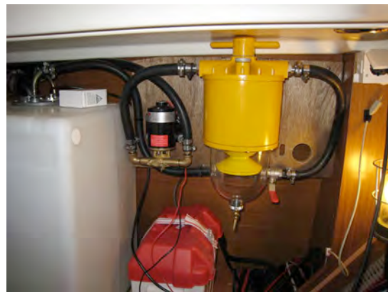
Bränslefilter extratank med stort vattenavskiljande filter