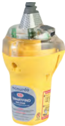
McMurdo Smartfind Plus GPS EPIRB