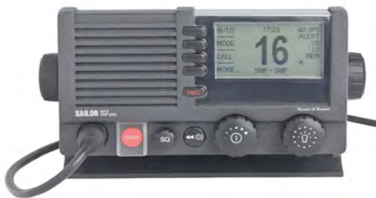
VHF - Thrane & Thrane 6215 DSC