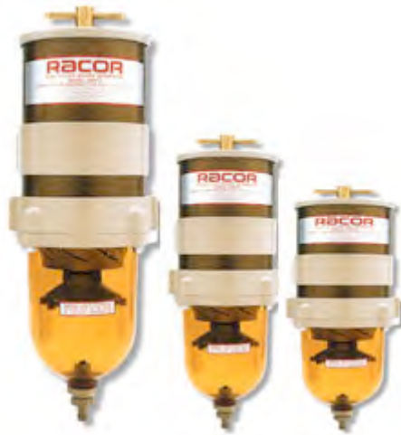
Racor bränslefilter 500 FG Turbine

Xenon ljus - Hella flodljus (Dyrt som tusan, men 10 ggr bättre än 50w halogen kurvlyjus)